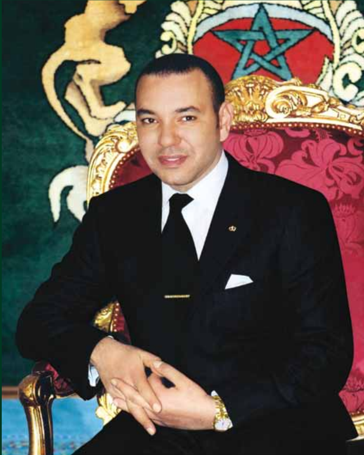
Su Majestad El Rey Mohammed VI, que Dios Le Bendiga