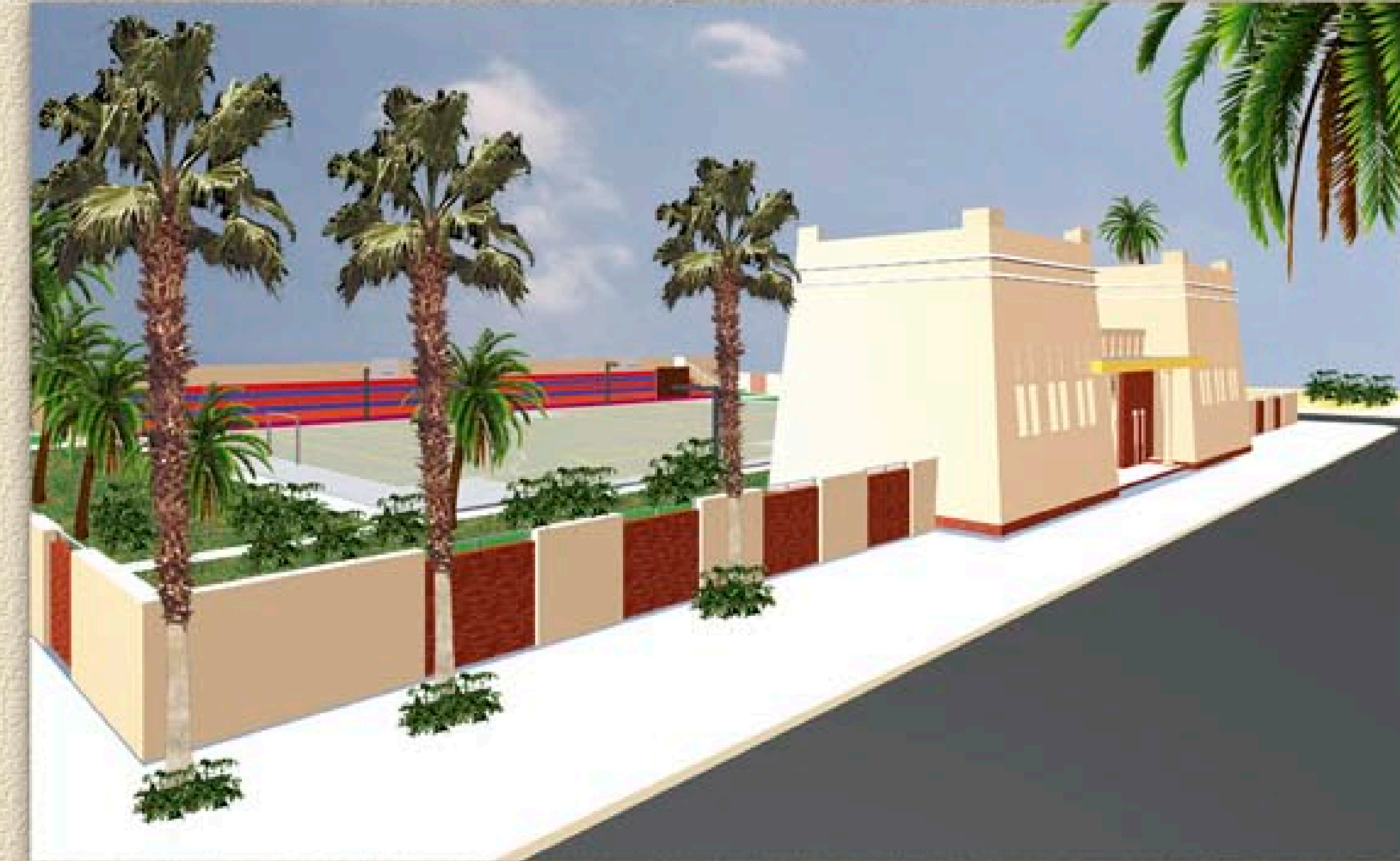
منظور إجمالي للمشروع