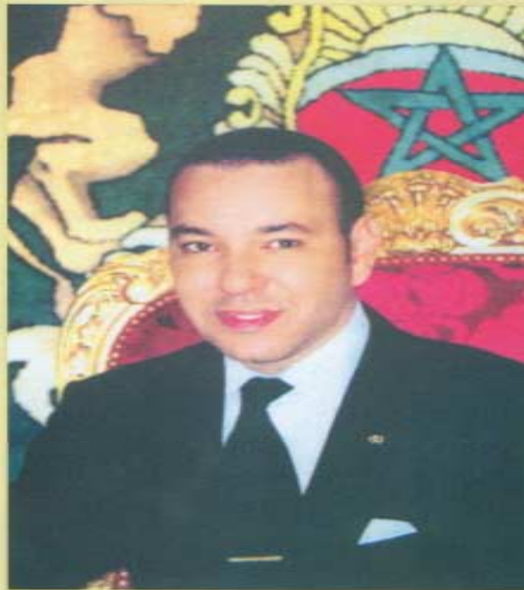
صاحب الجلالة الملك محمد السادس نصره الله